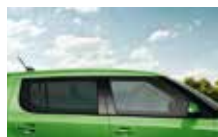
Skla s vyšším stupněm tónování SunSet