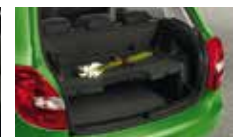
Volitelná pozice krytu zavazadového prostoru