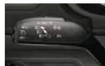
Tempomat pro udržování nastavené rychlosti